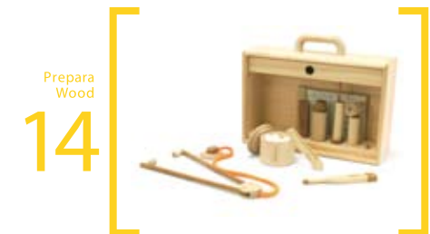
14 Prepara Wood ドクターバッグ 10 箱=31cm×25cm×11cm 注射器・聴診器・体温計・問診票・消毒綿・せしし・耳鏡・ぬり薬・のみ薬・カバン・ガイドブック(2冊)