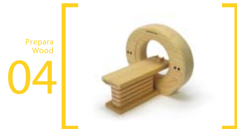
04 Prepara Wood MRI ミニ=7.5cm×10cm×7.5cm S=17cm×23cm×17cm L=40cm×52cm×42cm 検査台が前後に動きます