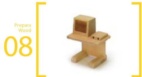
08 Prepara Wood 操作台 S=8cm×5cm×10cm CT・MRI用の操作台です