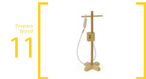
11 Prepara Wood 点滴台 S=5cm×5cm×15cm L=15cm×15cm×45cm Sは点滴バッグがつきます Lには点滴バッグがついていません