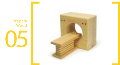
05 Prepara Wood CT ミニ=8.5cm×7.5cm×7cm S=18cm×19cm×17cm L=48cm×42cm×40cm 治療台が前後に動きます