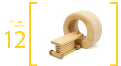
12 Prepara Wood G-MRI S=20cm×26cm×18cm 治療台にタイヤが付いていて切り離すことができます。また、治療台上部は前後に動きます