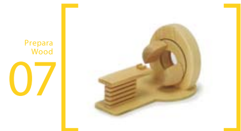
07 Prepara Wood RI(ガンマカメラ・シンチカメラ) ミニ=9cm×16cm×9.5cm S=20cm×25cm×35cm カメラ部は360度回転し、また上下に動きます 診察台は前後に動きます