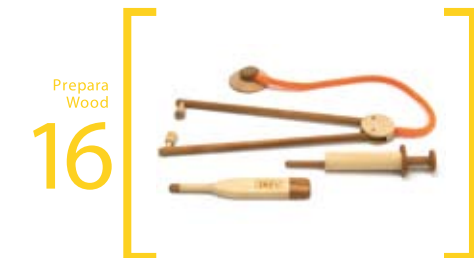
16 Prepara Wood ドクターバッグ 03 サイズ=縦 26cm～14cm・横 6cm～2.4cm 注射器・聴診器・体温計 ガイドブック(2冊)