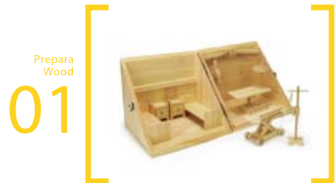
01 Prepara Wood 手術セットA(手術・病室セット) S=30cm×23cm×20cm 病室側にはベット・引出し、手術室側には手術台無影灯大・小が付いています 点滴台とストレッチャーが付いています

●サイズはミニ・Sサイズ・Lサイズの三種類。製品によってサイズ展開は異なります。●神奈川、山梨県産材のひのき・ぶな・シナ合板・かつらを使用して います。●仕上げは無塗装。木が本来持つ温もりをお楽しみいただけます。