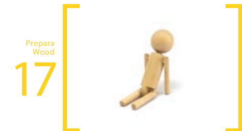
17 Prepara Wood ふればらウッド S 人形 S=3.5cm×4.0cm×14cm 手と足が動きます。ふればらウッド S サイズの製品に使用できる大きさです