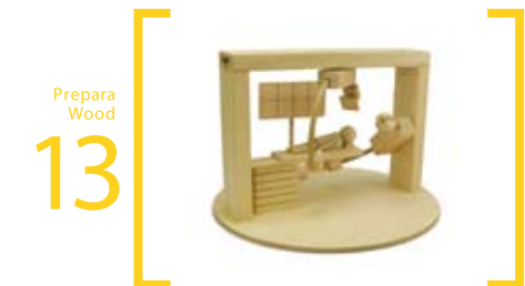
13 Prepara Wood 血管造影機 S=20cm×25cm×35cm 治療台は前後に動きます 上部C型アームは前後、左右、回転する事が出来ます 側部C型アームは左右、回転する事が出来ます