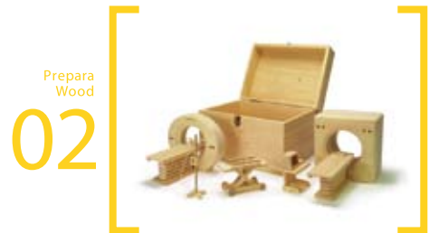
02 Prepara Wood 検査セット(CT・MRIセット) S=20cm×25cm×20cm ストレッチャー・MRI・CT・操作台・点滴台があります また、5点すべてが収納できる箱が付きます