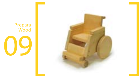
09 Prepara Wood 車いす L=18cm×22cm×20cm 車輪が動きます