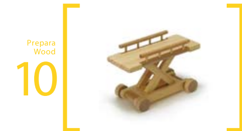
10 Prepara Wood ストレッチャー S=12cm×5cm×6cm L=35cm×16cm×21cm 車輪が動きます また、ベット部分の柵が動きます