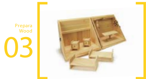
03 Prepara Wood 手術・病室ボックス S=30cm×23cm×20cm 病室側にはベット・引出し、手術室側には手術台無影灯大・小が付いています